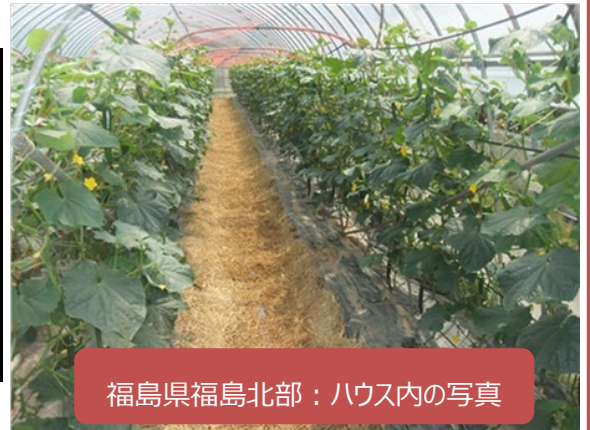
福島県福島北部：ハウス内の写真