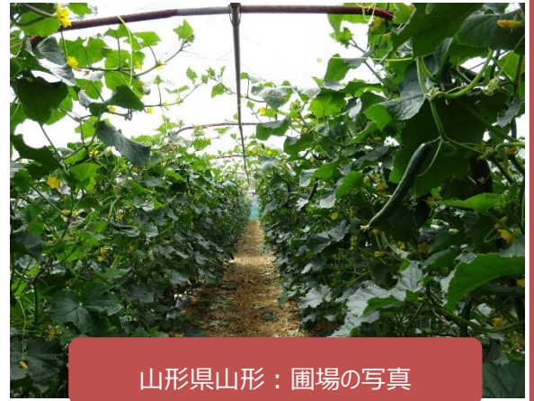
山形県山形：圃場の写真