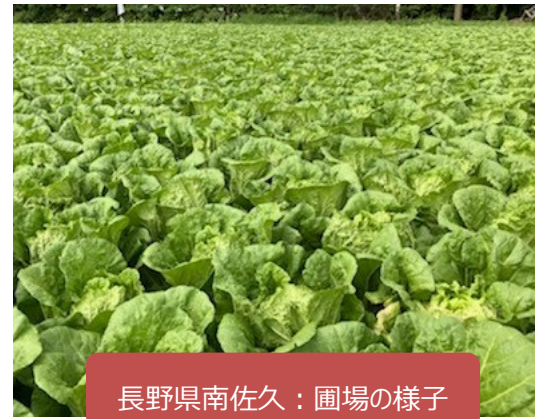
長野県南佐久：圃場の様子