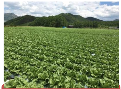
長野県川上：圃場の写真