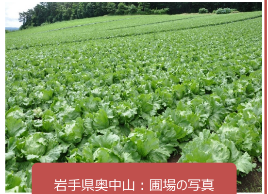
岩手県奥中山：圃場の写真