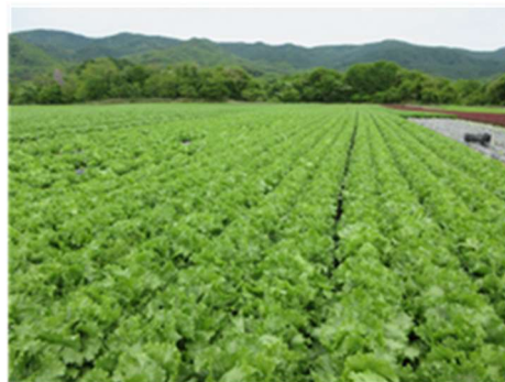
群馬県あがつま：圃場の様子