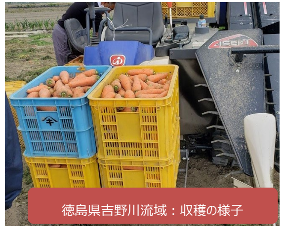
徳島県吉野川流域：収穫の様子