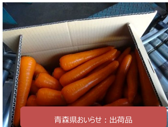
青森県おいらせ：出荷品