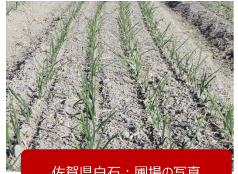
佐賀県白石：圃場の写真