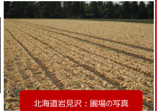
北海道岩見沢：圃場の写真