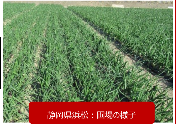
静岡県浜松：圃場の様子