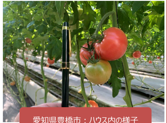
愛知県豊橋市：ハウス内の様子